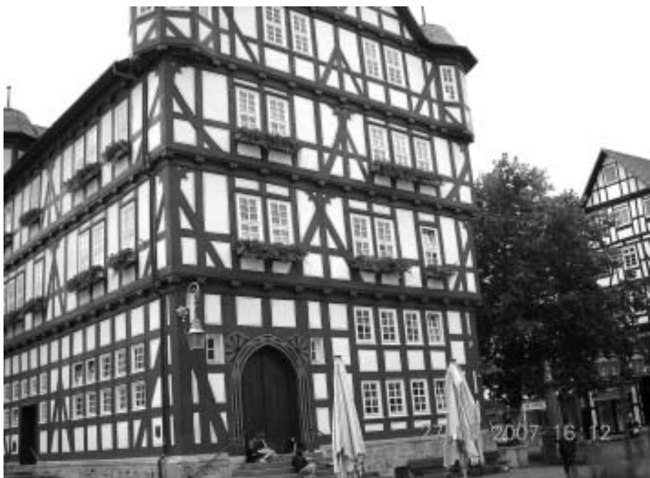
На фото: Егорова Н.В. с лесорубом; здание городской ратуши.