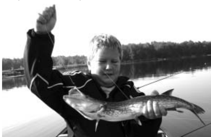
Рыбалка на реке Делавер (США)

Много воды утекло в речке Устье за эти десятилетия. Река обмелела, заросла, да и чистота воды оставляет желать лучшего, хотя вредных стоков стало меньше. Печально смотреть на берега, заваленные мусором. Какая уж там рыба. Вспоминается шутка Аркадия Райкина: «Когда то в реках и озерах рыба водилась».