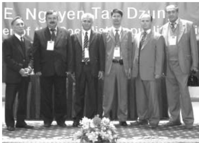
Встреча вьетнамской делегации с руководством холдинга «Кондор-Эко – СФ НИИОГАЗ»